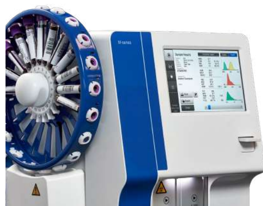
Los analizadores M-series M32S con cargador automático son ideales para hospitales pequeños y medianos que necesitan funcionalidades de análisis autónomas.