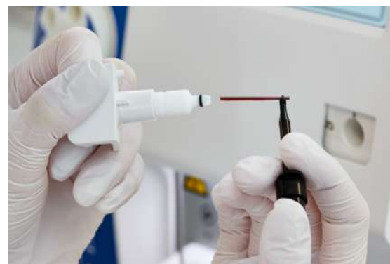
Los analizadores Medonic M-series M32 proporcionan un hemograma completo a partir de tan solo 20 µl de sangre, por lo que son extremadamente adecuados para niños y bancos de sangre.

Aunque disfrutará trabajando con su analizador Medonic, habrá ocasiones en las que tendrá que alejarse del sistema y dejar que analice un lote completo de muestras sin su supervisión. En estos casos, el modelo M32S es el equipo perfecto para su mesa de trabajo. Como modelo de gama alta, Medonic M-series M32S es el analizador autónomo idóneo para muchos hospitales pequeños y medianos. Basta con precargar hasta 2 x 20 muestras y dejar que haga todo el trabajo.